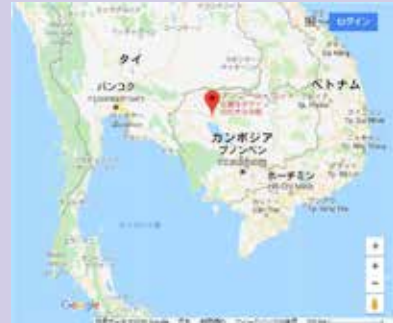
カンボジア・アンコールワット遺跡

プノンペン・ロータリー・クラブは毎週金曜日の12:00~1:30 PMに開催されます。ソテーロス大通りのアーモンド・ホテルの隣にあるKANJIレストランでお会いしましょう。